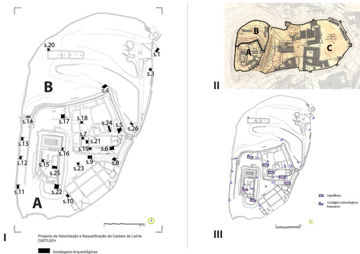
Figura 1 – I – Localização das sondagens; II – Identificação dos núcleos do Castelo; III – Localização dos vestígios osteológicos humanos. © Augusto Aveleira.

ZÚQUETE, Afonso (2003) – Monografia de Leiria: A cidade e o Concelho – 1950 . Leiria: Folheto.