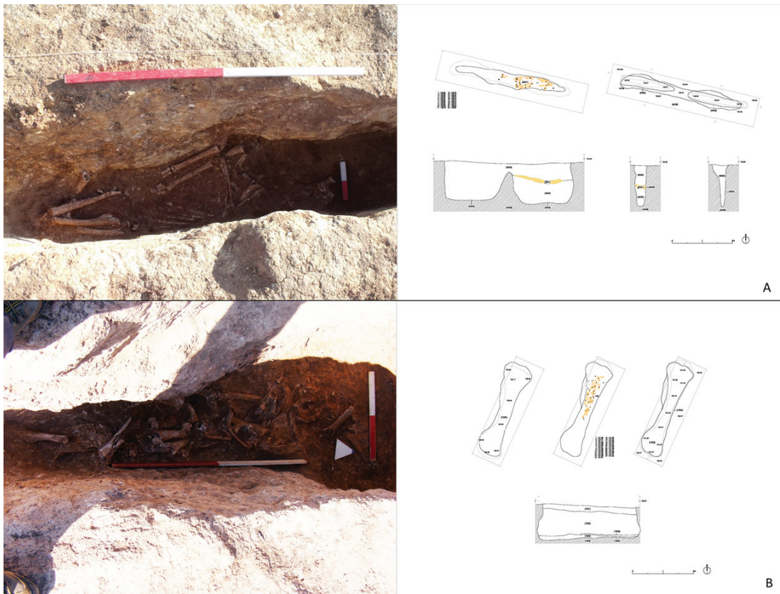
Figura 3 – Monte das Aldeias: A – Estrutura N.º 40 e Monte da Barrada 1; B – Estrutura N.º 15.