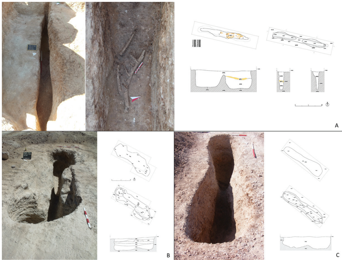
Figura 4 – Monte do Outeirinho Novo: A – Estrutura N.º 7; Montinhos 6: B – Estrutura N.º 12; e Vale Frio 2: C – Estrutura N.º 19.