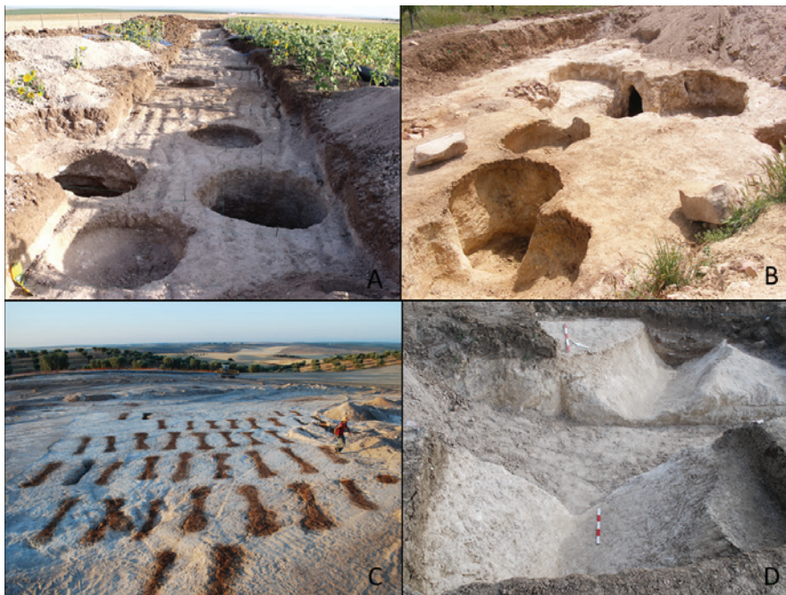
Figura 2 – Morfologia das estruturas: A – Vale de Éguas 3 – concentração de estruturas de tipo “fossa”; B – Torre Velha 12 – concentração de estruturas de tipo “fossa” e hipogeus; C – Montinhos 6 – concentração de estruturas de planta em “osso”; D – Horta da Morgadinha 2 – valado/fosso de perfil em V (sond. N.º 31/32).