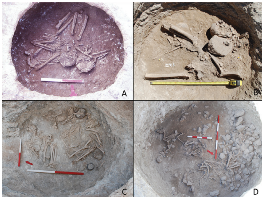
Figura 3 – Práticas de inumação: A – Santo Estevão 1 – nível de inumação humana em “fossa” com 2 indivíduos (um em decúbito lateral e outro em posição sentada) (sond. N.º 7); B – Montinhos 6 – nível de inumação em “fossa” de um indivíduo em posição sentada com um dorminte junto ao ventre (sond. N.º 127); C – Montinhos 6 – nível de inumação humana em hipogeu com inumações primárias e ossário (sond. N.º 59); D – Horta da Morgadinha 2 – nível de inumação de animais (maioritariamente canídeos) (sond. N.º 19).