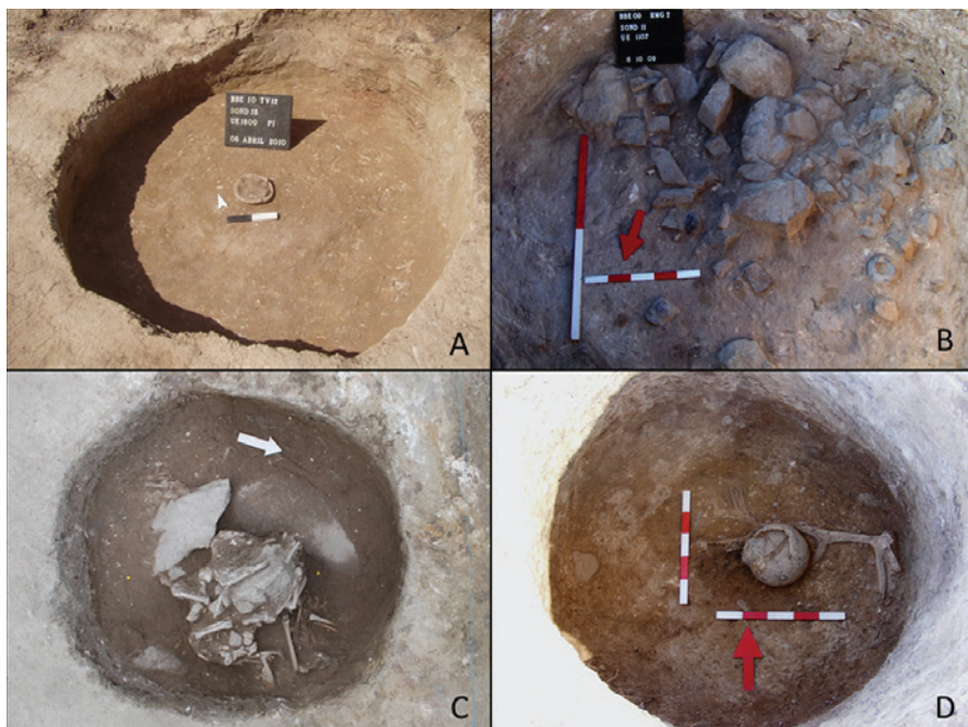
Figura 4 – Concentração de materiais: A – Torre Velha 12 – deposição de um prato no centro de estrutura (sond. N.º 18); B – Horta da Morgadinha 2 – nível de concentração de elementos pétreos e cerâmicos (sond. N.º 11); C – Horta da Morgadinha 2 – nível de elementos faunísticos (sond. N.º 14); D – Montinhos 6 – deposição de um vaso sobre uma haste de veado (sond. N.º 100).