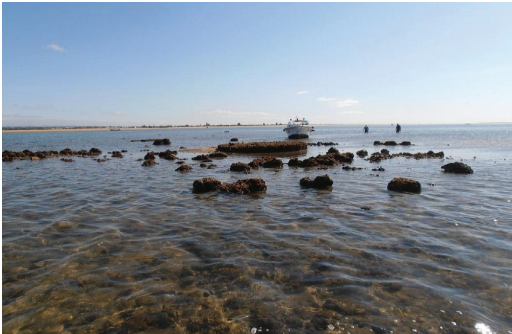
Figura 2 – Sítio do Forte de São Lourenço, 2012.