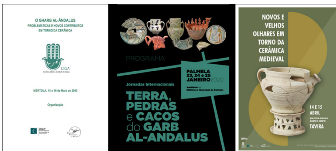
Figura 3 - Cartazes de divulgação de encontros e jornadas promovidas pelo CIGA.