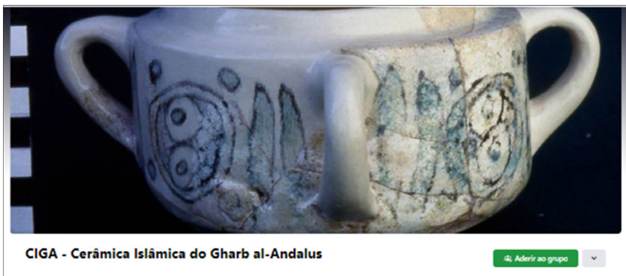
Figura 6 – Pormenor da página do Facebook do CIGA - Cerâmica Islâmica do Gharb al - Andalus.