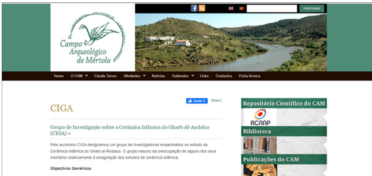
Figura 4 – Pormenor da página do CIGA no website do Campo Arqueológico de Mértola.