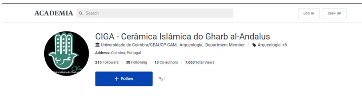
Figura 5 – Pormenor da página do CIGA na Academia edu.