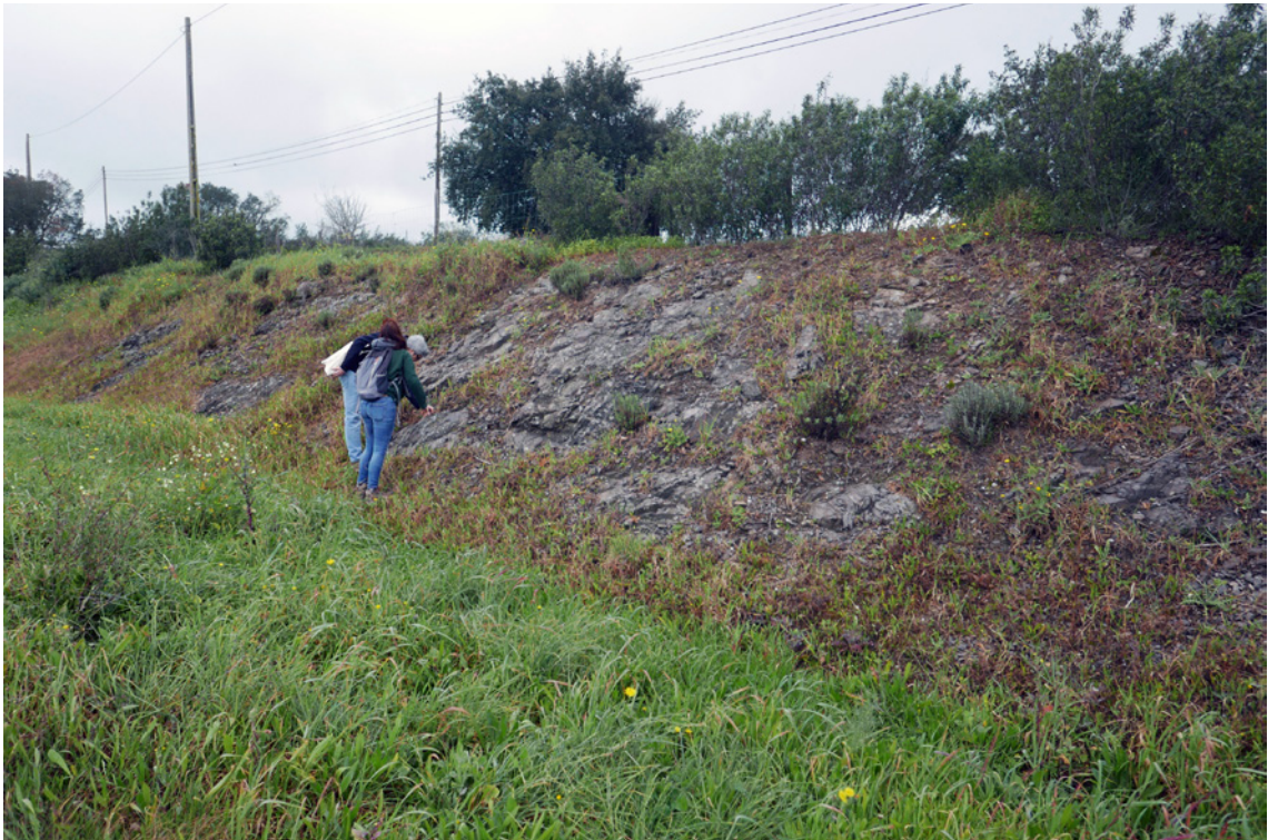
Figura 3 – Trabalhos de campo e recolha de amostras de xisto no âmbito do projecto EXPLORSCHIST – Exploring exchanges routes of schist artefacts in Iberian Chalcolithic by micro and non-destructive analytical methods.