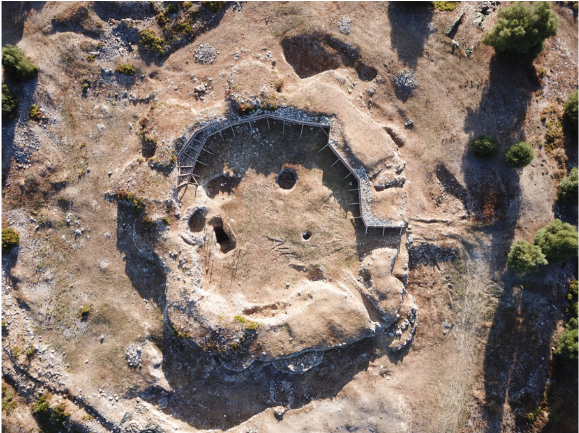
Figura 2 – Acompanhamento Arqueológico da obra de Contenção dos Taludes do Reduto Central no sítio arqueológico Vila Nova de São Pedro. Aspecto final.