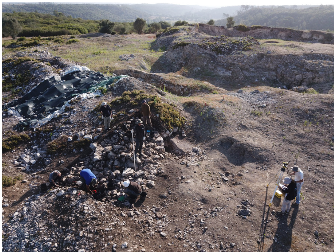
Figura 1 – Campanha 2023 em VNSP.

Os dados referentes à intervenção arqueológica realizada em VNSP encontram-se descritos no Relatório do PATA, entregue à tutela (Figura 1).