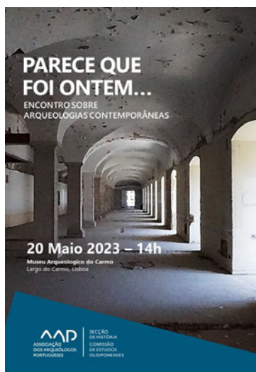
Figura 1 – Cartaz de divulgação do colóquio “Parece que foi ontem... – Encontro sobre Arqueologias Contemporâneas”.

Ao longo do ano de 2023 a mesa da Comissão de Estudos Olisiponenses continuou a recolher os artigos correspondentes a conferências e comunicações apresentadas no âmbito das reuniões e colóquios organizados nos últimos anos, tendo em vista a sua publicação. Nesse aspecto, encontra-se em processo de maquetagem os textos correspondentes ao ciclo de conferências “Lisboa não é só subterrânea – 25 anos depois de uma exposição”, ocorrido em 2019 e cujas actas, tal como previsto, serão publicadas num suplemento da revista O Arqueólogo Português . A sua apresentação terá certamente lugar ainda durante o presente ano de 2024.