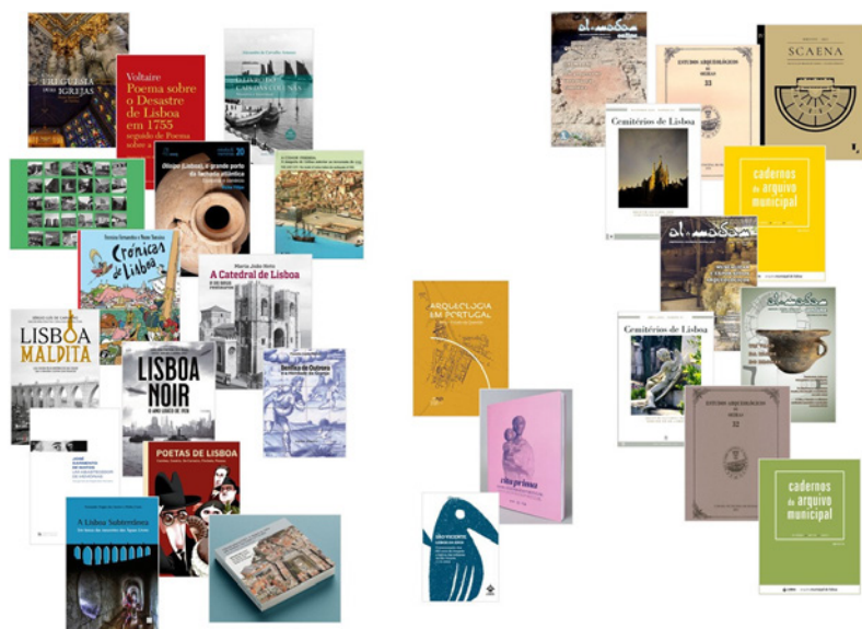
Figura 2 – Publicações sobre a História e Património da cidade de Lisboa editadas durante o ano de 2023.

WAA (2023) – Políticas de habitação em Lisboa, da Monarquia à Democracia . Lisboa: Câmara Municipal. (