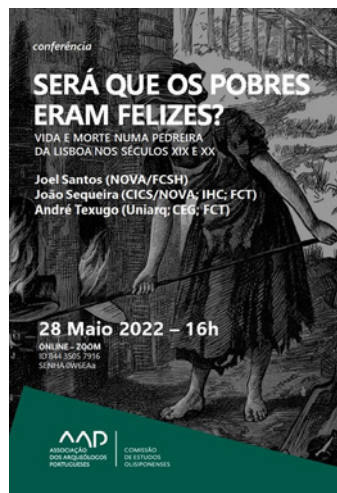
Figura 1 – Cartaz de divulgação da conferência organizada pela Comissão de Estudos Olisiponenses no dia 28 de Maio de 2022.

No dia 8 de Outubro, em colaboração com a Sec-