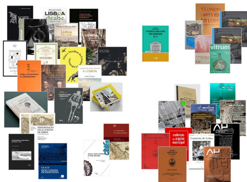
Figura 2 – Publicações sobre a História e Património da cidade de Lisboa editadas durante o ano de 2022.

VVAA (2022) – Uma Casa em Lisboa. Homenagem a José Saramento de Matos . Lisboa: Museu de Lisboa/EGEAC.