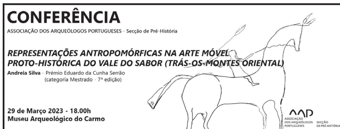
Figura 2 – Poster da Conferência “Representações antropomórficas na arte móvel da Proto-História do Vale do Sabor (Trás-os-Montes Oriental)”.