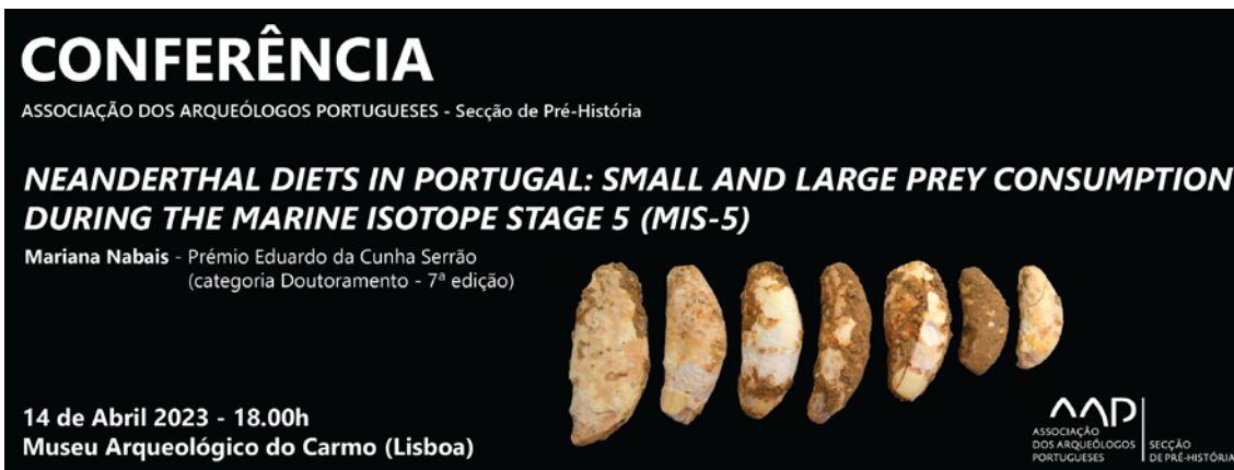
Figura 1 – Poster da Conferência “Neanderthal Diets in Portugal: Small and Large Prey Consumption during the Marine Isotope Stage 5 (MIS-5)”.