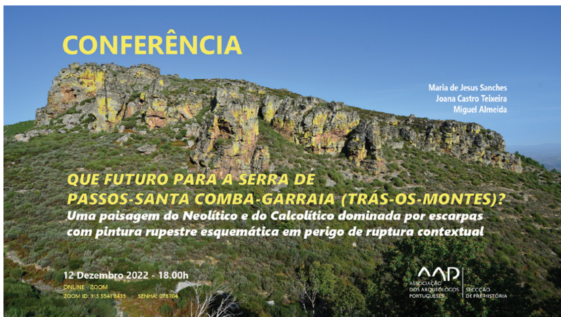
Figura 2 – Poster da Conferência “Que futuro para a Serra de Passos-Santa Comba-Garraia (Trás-os-Montes)? Uma paisagem do Neolítico e do Calcolítico dominada por escarpas com pintura rupestre esquemática em perigo de ruptura contextual”.