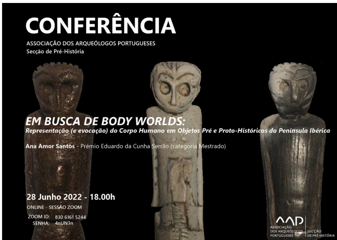
Figura 1 – Poster da Conferência “Em busca de body worlds: representação (e evocação) do corpo humano em objetos pré e proto-históricos da Península Ibérica”.