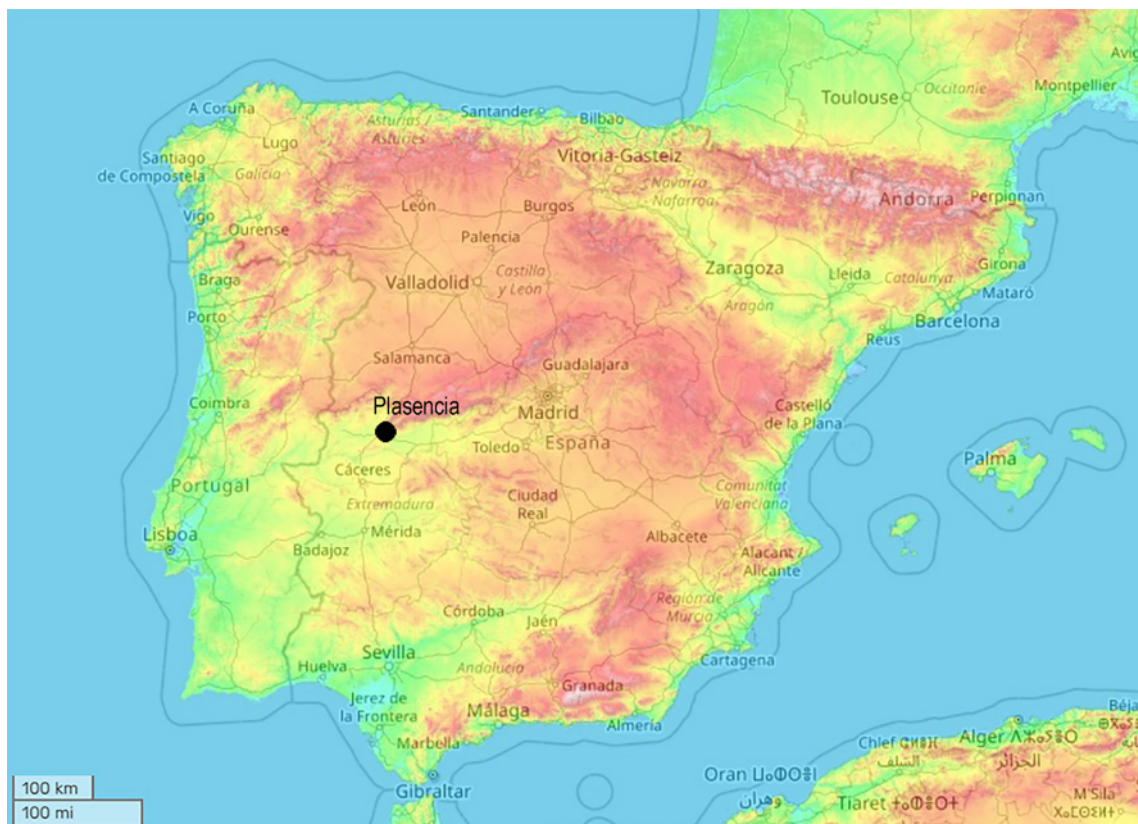
Figura 1 – Localização de Plasencia na Península Ibérica.

Este curioso testemunho arqueológico será proveniente da região de Plasencia (Cáceres), na Extremadura Castelhana, e foi oferecido em 1905, por Vicente Paredes y Guillén, ao hoje Museu Nacional de Arqueologia, então dirigido por José Leite de Vasconcellos (1906, p. 91; 1934, p. 50) (Beirão e Gomes, 1985, pp. 492, 493, fig. 8).