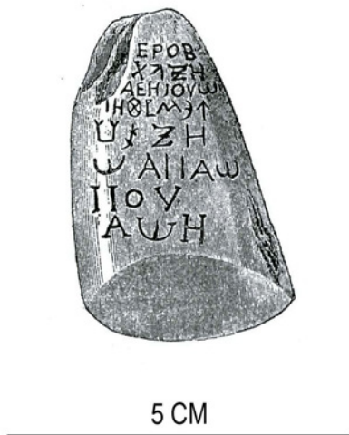
Figura 3 – Lâmina de machado de jade/nefrite, medindo 0,047 m de altura, adquirida, no século XIX, no Egípto e hoje no British Museum. Oferece inscrição grega, onde se identifica o nome de Yavé (seg. C. A. Faraone, 2014, p. 13, fig. 7).