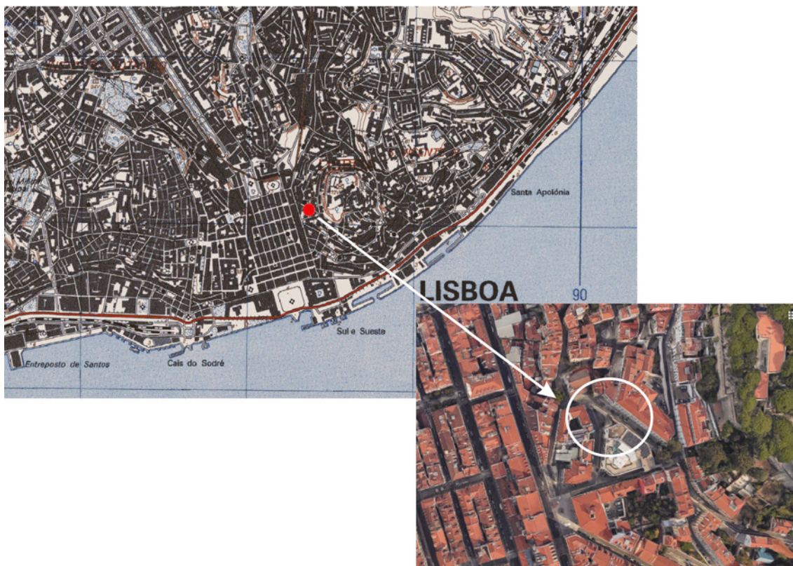
Figura 1 – Localização do Largo da Atafona (Carta militar 1/25000; Imagem Google Maps).

Antes da construção do edifício do Mercado, existia no local um quarteirão habitacional, desde o Século XVII, que pode ser observado na planta de Tinoco de 1650. Este espaço terá sofrido ao longo dos tempos alterações e remodelações, mas parece ter resistido ao Terramoto de 1755, como pode ser observado nas plantas de Mardel de 1756 e de Guilherme de Menezes de 1761. (Figura 2)