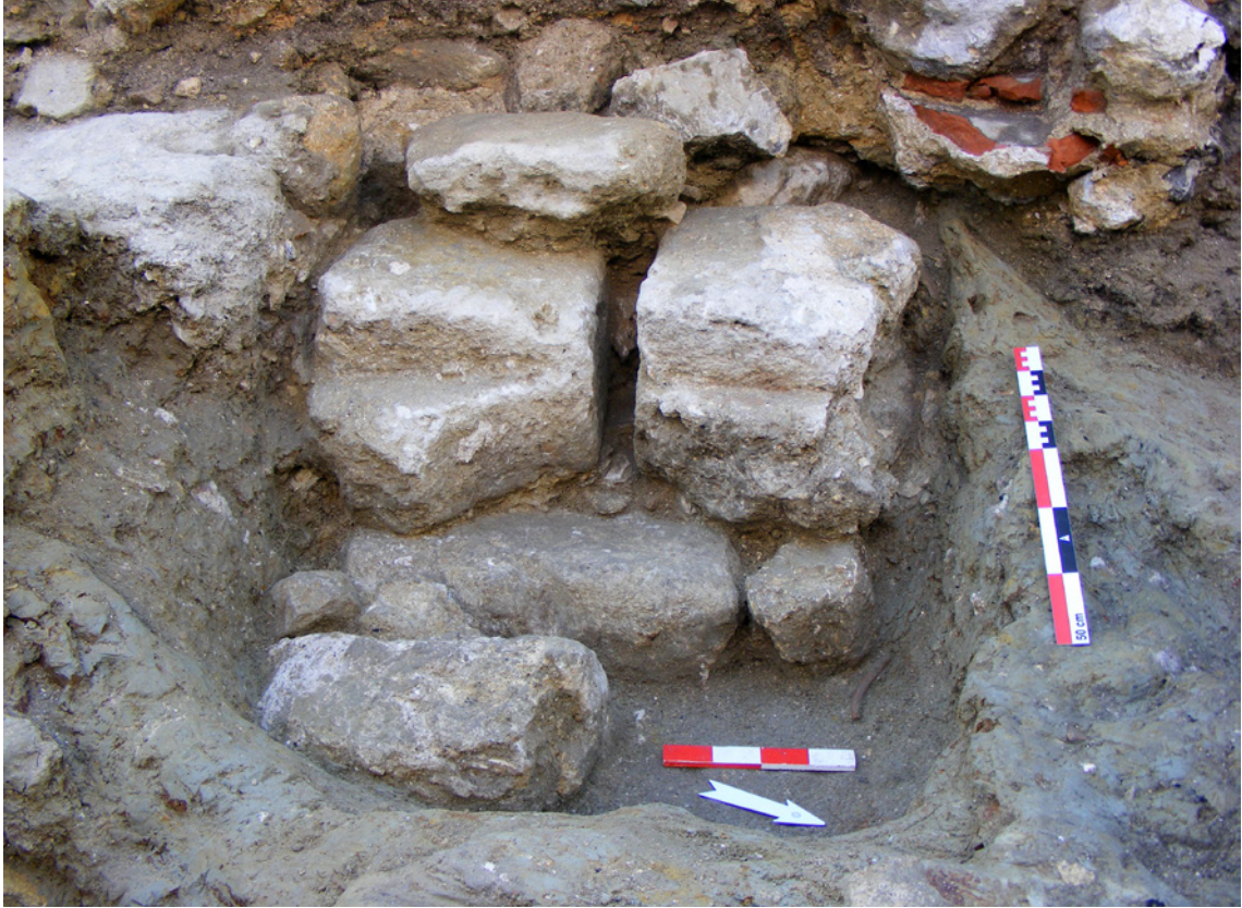
Figura 4 – Atafona manual do Século XIV.