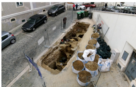
Figura 2 – Vista geral da área intervenção.