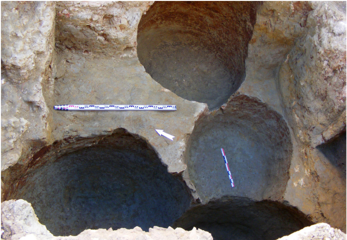
Figura 6 – Imagem geral dos silos – área Sul (em cima) e área Norte (em baixo).