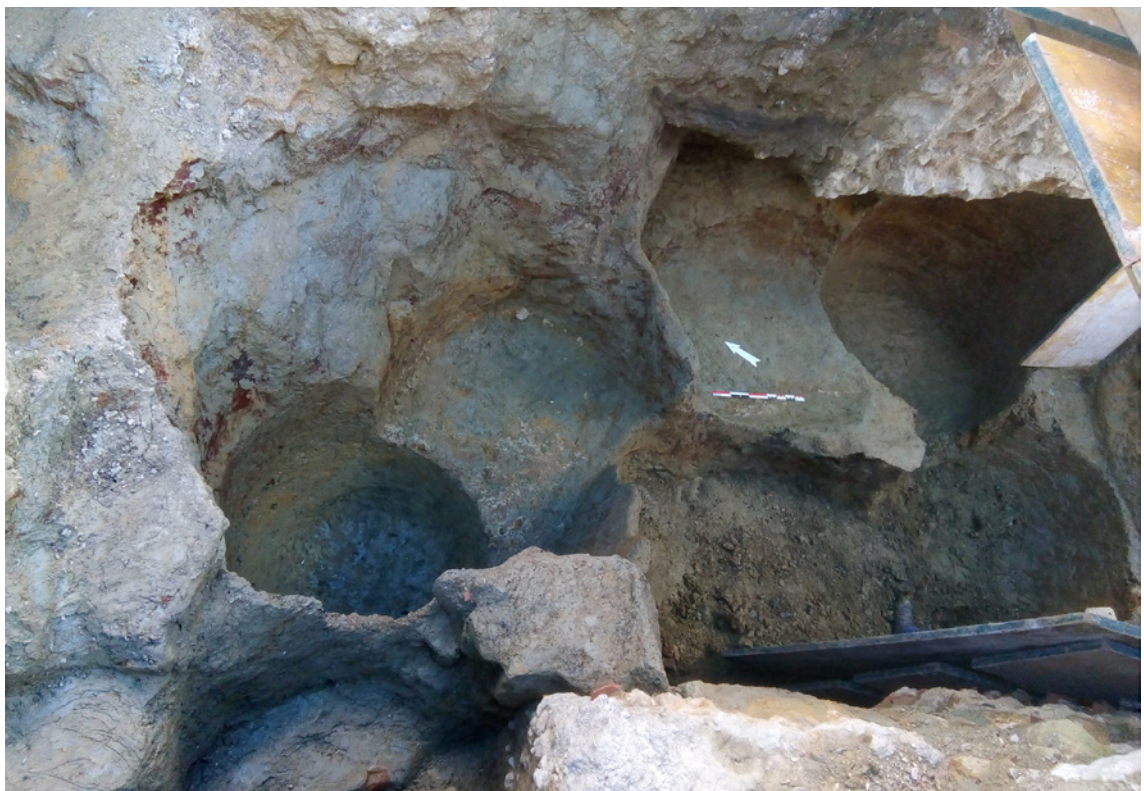
Figura 5 – Imagem geral dos silos – área Sul.