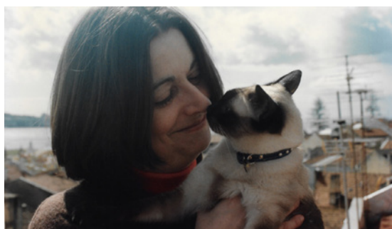
Figura 3 – Algés, anos 90.