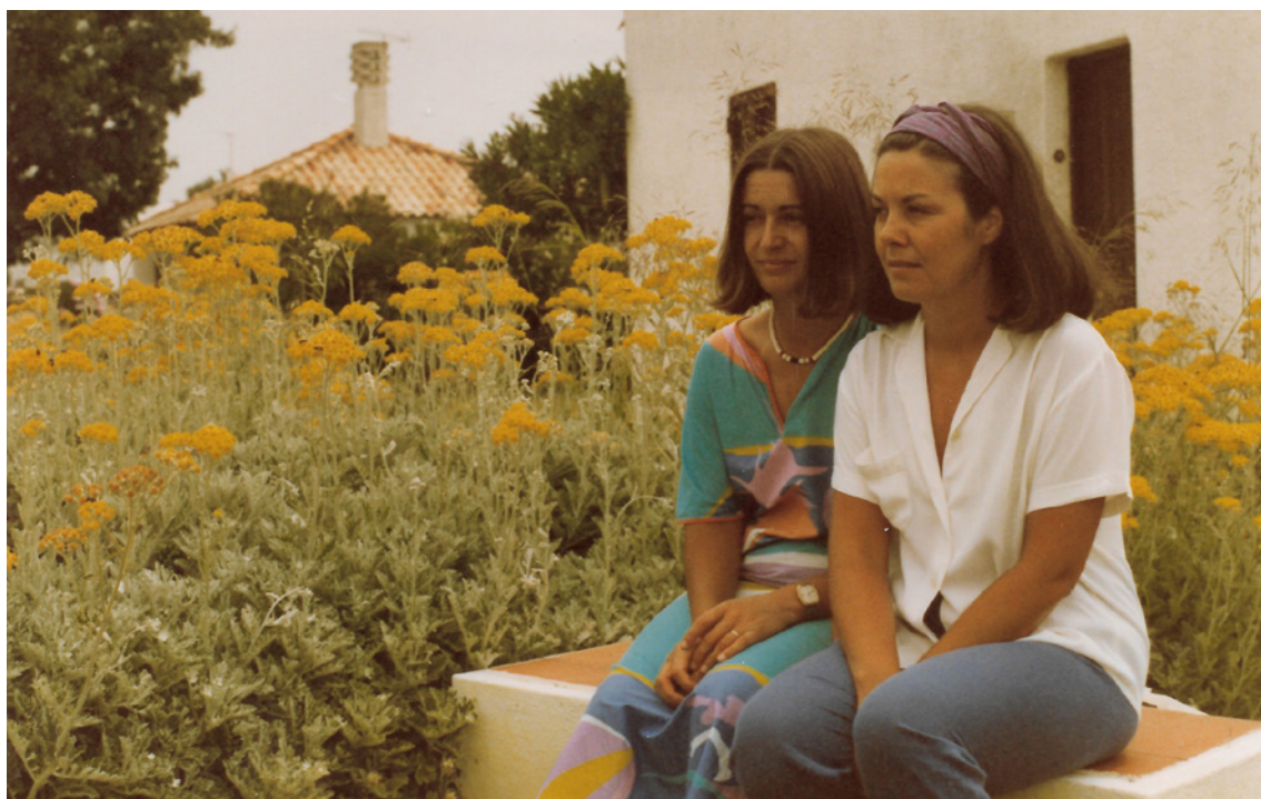
Figura 1 – Pedras d' El Rei, Tavira, anos 80.