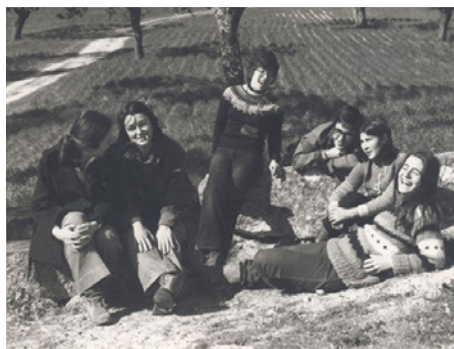
Figura 4 – Sul, segunda metade dos anos 70.