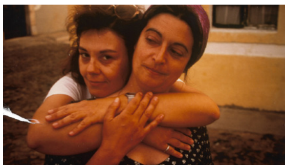
Figura 2 – Cabeço da Azurria, Cuba, anos 90.