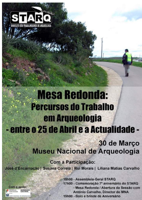
Figura 1 – Cartaz da Mesa Redonda “Percurso do Trabalho em Arqueologia, entre o 25 de Abril e a actualidade”, no Museu Nacional de Arqueologia, 30 de Março de 2019).