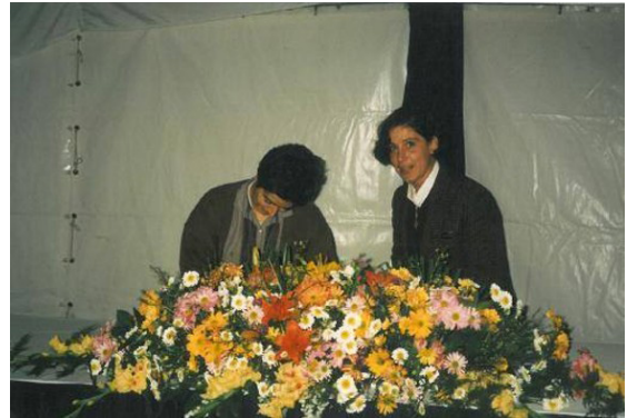
Figura 6 – Assinatura dos “Itinerários Arqueológicos do Alentejo e do Algarve”, Miróbriga, 1994.

Novo reencontro tivemos, quando em 1999, iniciiei a minha a minha colaboração direta com a Direção Regional do IPPAR, Évora, mediante concurso público.