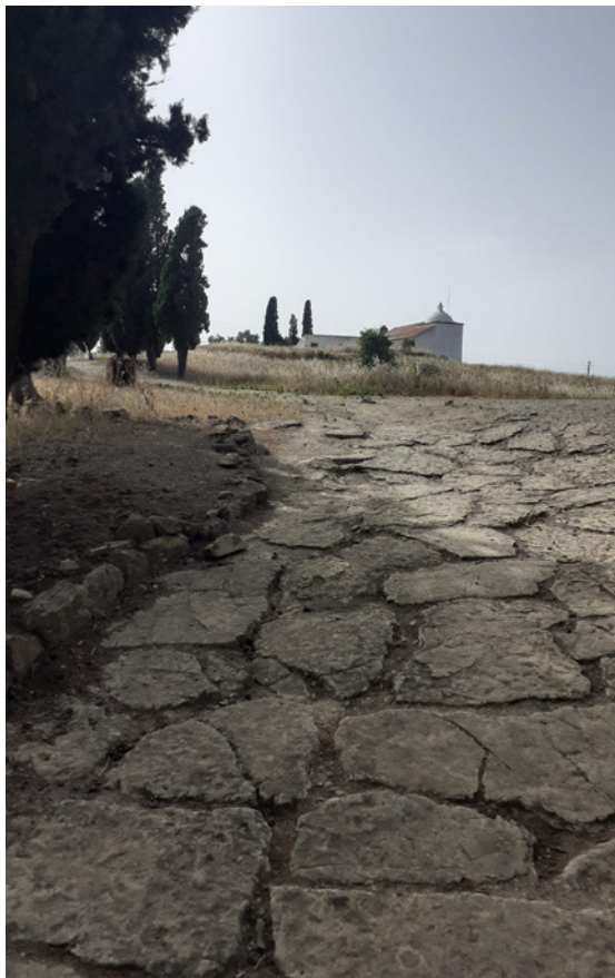
Figura 1 – Calçada de Miróbriga com Capela de S. Brás ao fundo.

Não me é fácil fazer um testemunho de homenagem a uma grande companheira de vida e trabalho. Nada poderá caber nas simples linhas que aqui partilharei.