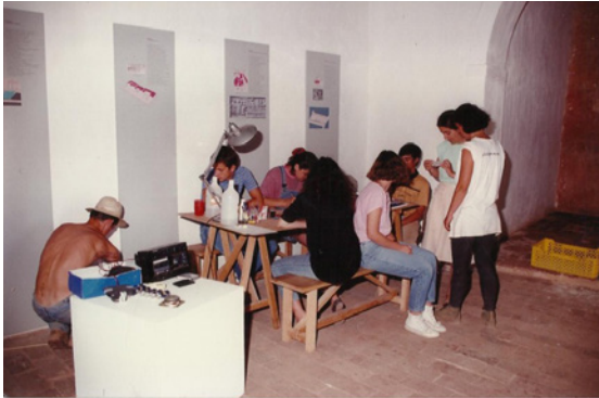
Figura 5 – Inventário dos materiais arqueológicos.

ção de materiais de divulgação e encetaram-se contactos com a Secretaria de Estado do Turismo, no sentido de Miróbriga ser integrada em circuitos turísticos.