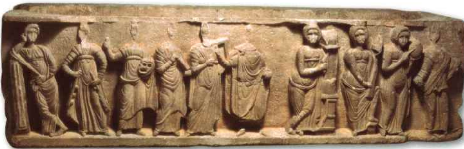
Sarcophage des Muses. III-IV e siècles, Marbre. Valado dos Frades, Nazaré.

Possidónio da Silva s'appliqua à recueillir d'innombrables fragments d'architecture et de sculpture ainsi que