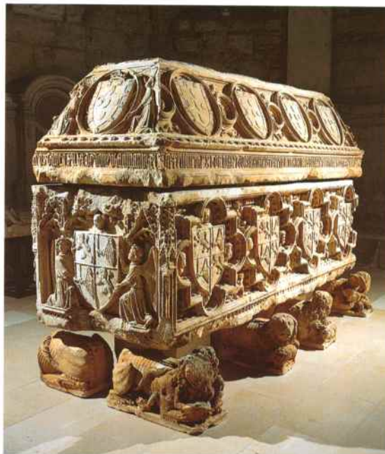
Tombeau de Fernando I er. 1380-1383. Pierre calcaire sculptée en bas et haut-relief. Couvent de S. Francisco de Santarém.

différentes fouilles parmi lesquelles se détache la collection de Vila Nova de São Pedro (Azambuja, période chalcolithique – 3500-2500 avant J.-C.) et il compte aujourd'hui près de mille pièces en exposition permanente.