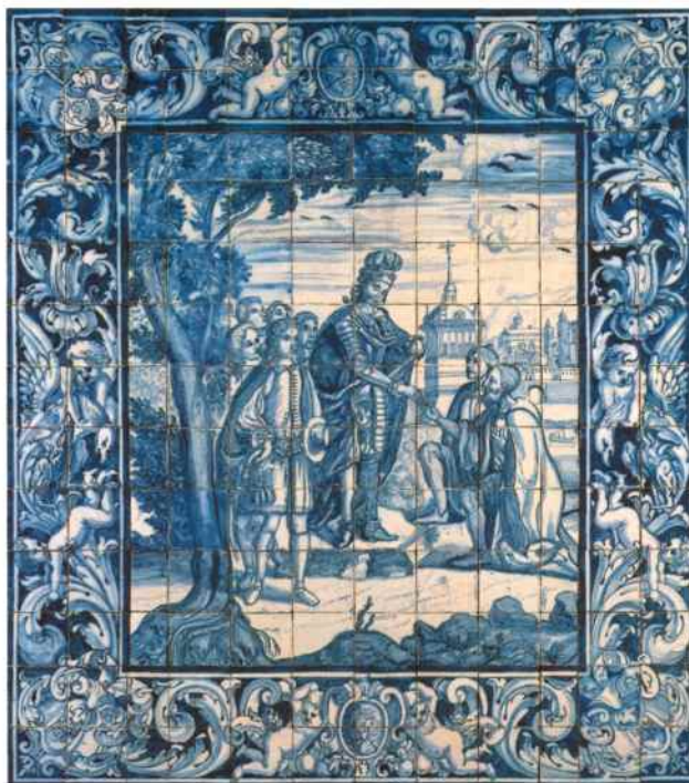
Panneau d'azulejos, baroque. XVIII e siècle. Atelier de Manuel dos Santos. Séminaire de São Patricio, Lisbonne.

culture et de repos, une espèce d'oasis en plein coeur de Lisbonne.