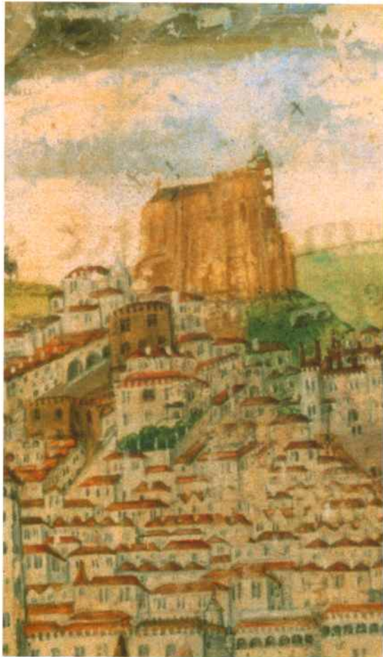
Église du Carmo au XVI e siècle. Détail de la vue panoramique de Lisbonne d'après António de Hollanda. Bibliothèque du Musée Condes de Castro Guimarães.

La construction de l'église du Carmo, fruit de la volonté et de la ferveur de son fondateur, le Grand Connétable Nuno Álvares Pereira, remonte à 1389.