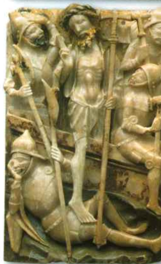
Résurrection du Christ. Plaque d'un retable évoquant des scènes de la Vie du Christ sculptées en relief, avec des vestiges de polychromie. XV e siècle. Ateliers de Nottingham, Angleterre.