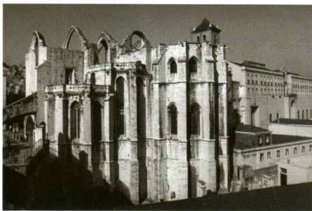
Vue du côté est de l'église et du couvent du Carmo.

Le couvent, de souche gothique, fit au cours des siècles l'objet d'agrandissements et de remaniements au gré des nouveaux styles d'architecture et des goûts en matière de décoration. En 1755 le violent tremblement de terre qui dévasta la ville de Lisbonne provoqua ici d'importants dégâts, encore aggravés par l'incendie qui s'ensuivit et détruisit la quasi-totalité du mobilier et des oeuvres d'art.