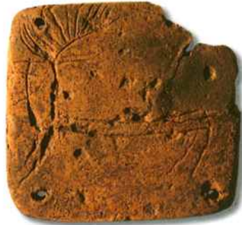
Plaque à décoration zoomorphique. Chalcolithique. Céramique. Vila Nova de São Pedro, Azambuja.

L e Musée archéologique du Carmo (installé dans les ruines de l'église du Carmo) a été fondé en 1864 par le premier président de l'Association des Archéologues portugais, Joaquim Possidónio Narciso da Silva (1806-1896). Il a été créé pour la sauvegarde du patrimoine national qui se dilapidait et se détériorait à la suite de l'abolition des ordres religieux (1834) et de la nationalisation de leurs biens, ainsi que de tous les saccages commis durant les invasions napoléoniennes puis les guerres civiles entre Absolutistes et Libéraux.