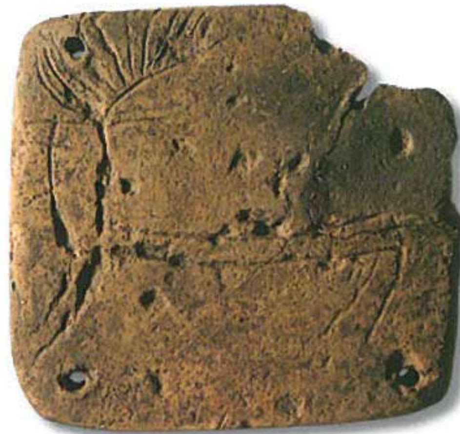
Placa con decoración zoomórfica. Calcolítico. Cerámica. Vila Nova de São Pedro, Azambuja.

E l Museo Arqueológico del Carmo (instalado en las Ruinas de la Iglesia del Carmo) fue fundado en 1864 por el primer presidente de la Asociación de los Arqueólogos Portugueses, Joaquim Possidónio Narciso da Silva (1806-1896). El Museo nació de los objetivos de rescate del patrimonio nacional que se iba dilapidando y deteriorando, como consecuencia de la extinción de las Órdenes Religiosas (1834), y de los numerosos daños infligidos durante las Invasiones Francesas y las Guerras Liberales.