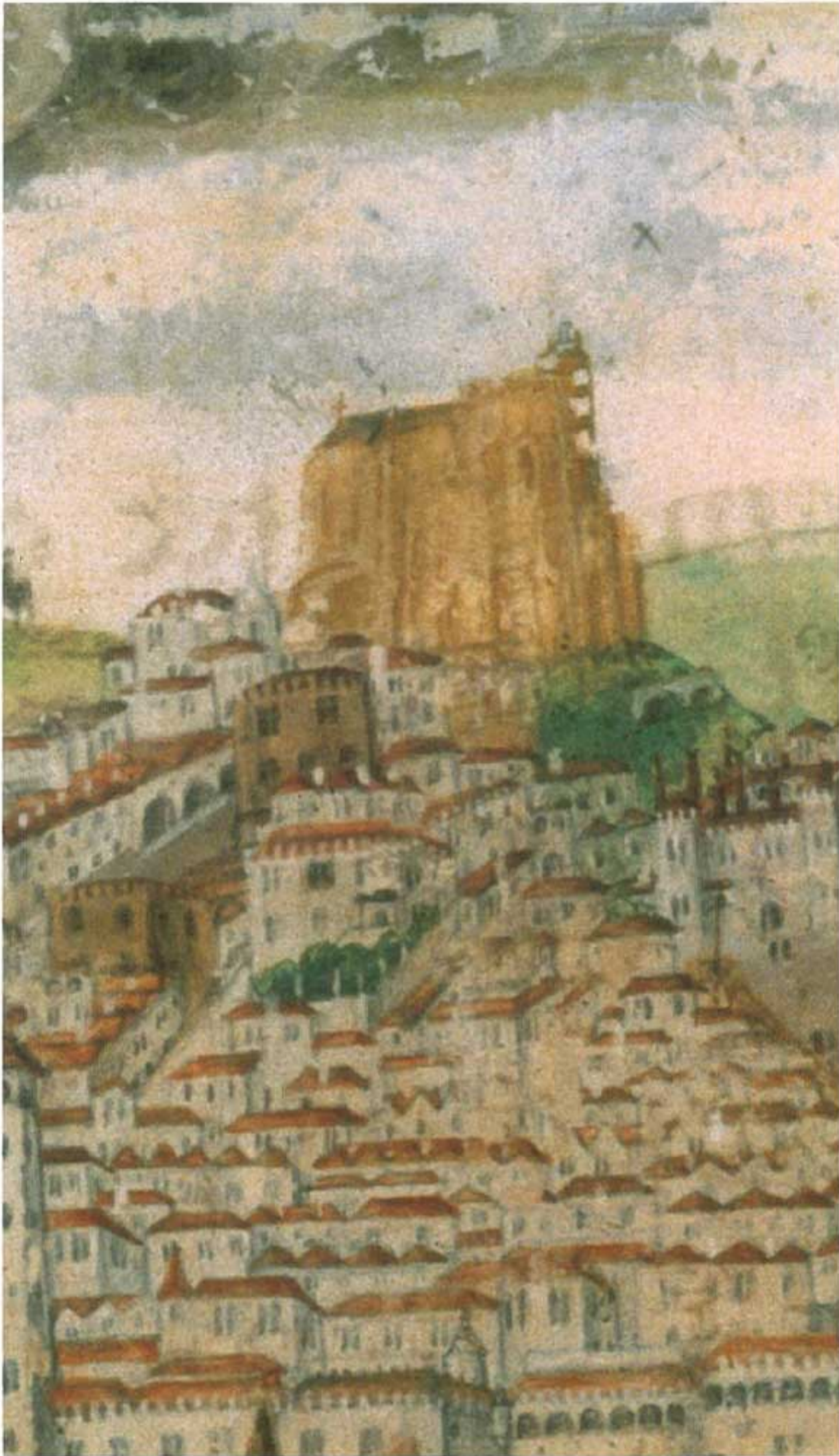
Iglesia del Carmo en el siglo XVI. Detalle de la vista panorámica de Lisboa de António de Hollanda. Biblioteca-Museu Condes de Castro Guimarães.

La construcción de la Iglesia del Carmo se remonta al año 1389, impulsada por el deseo y devoción religiosa de su fundador, D. Nuno Álvares Pereira, Condestable del Reino.