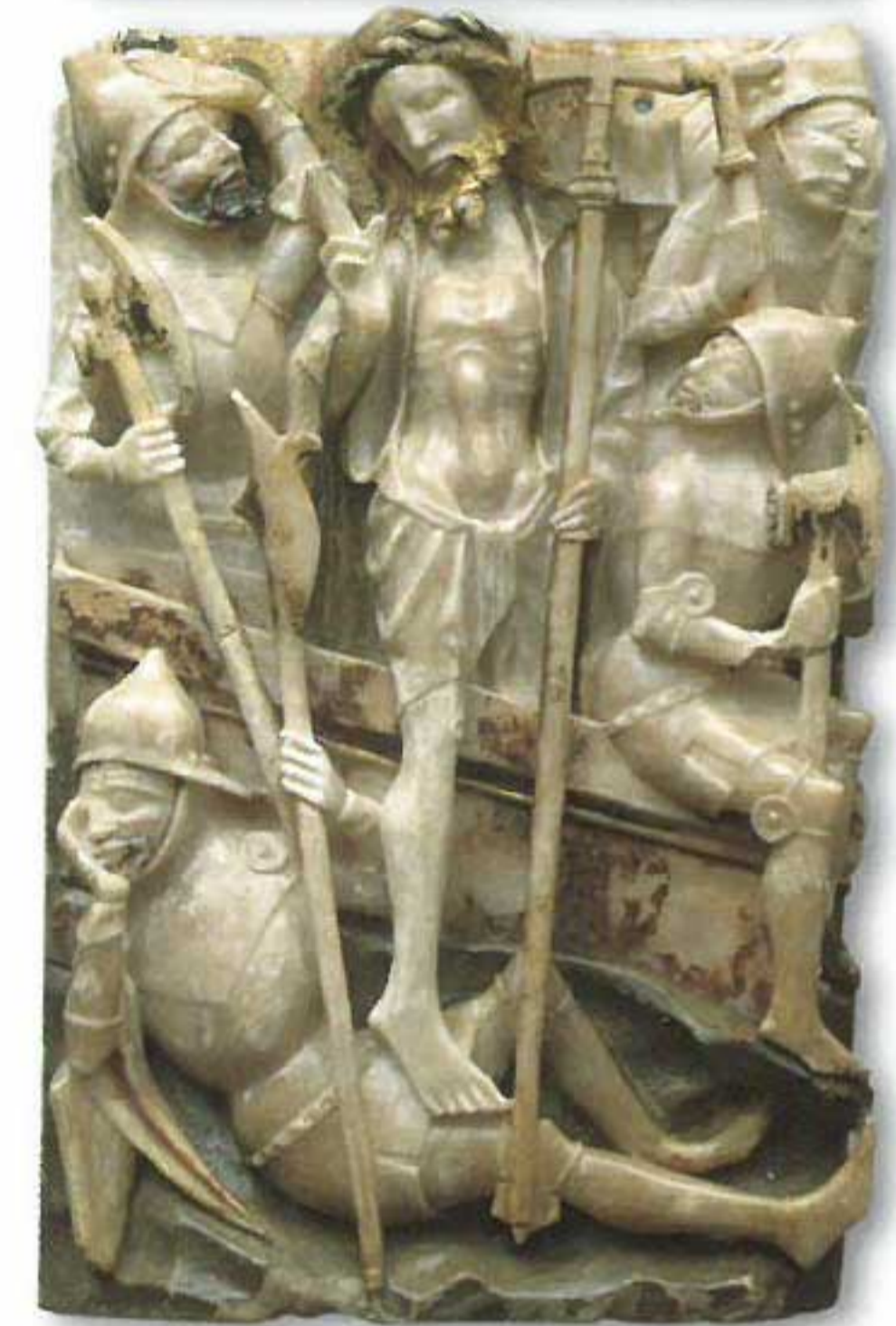
Resurrección de Cristo. Placa de un retablo con escenas de la Vida de Cristo, esculpidas en relieve y con restos de policromía. Siglo XV. Taller de Nottingham, Inglaterra.