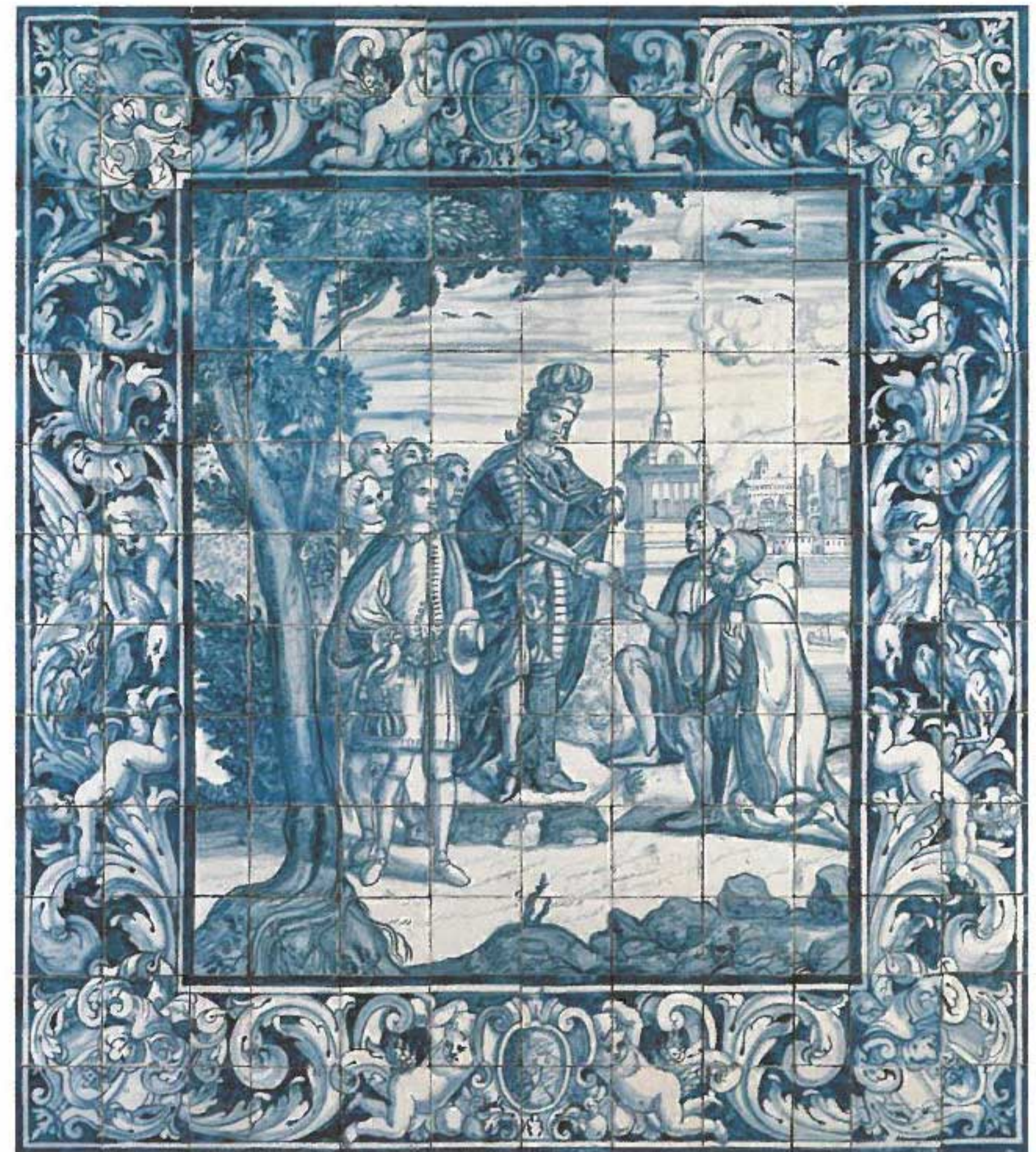
Panel de azulejos barroco. Siglo XVIII. Taller de Manuel dos Santos. Seminario de São Patrício, Lisboa.

de cultura y de reposo, una especie de “isla de la paz” en plena Baixa lisboeta.