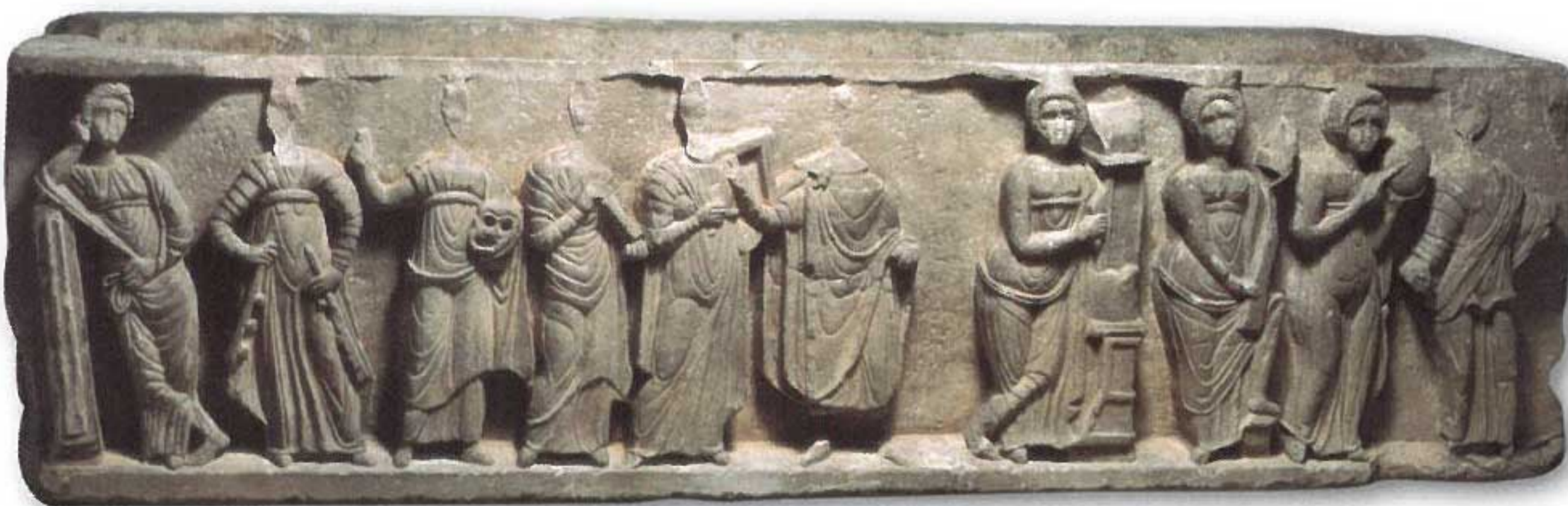
Sarcófago de las Musas. Siglos III-IV. Mármol. Valado dos Frades, Nazaré.