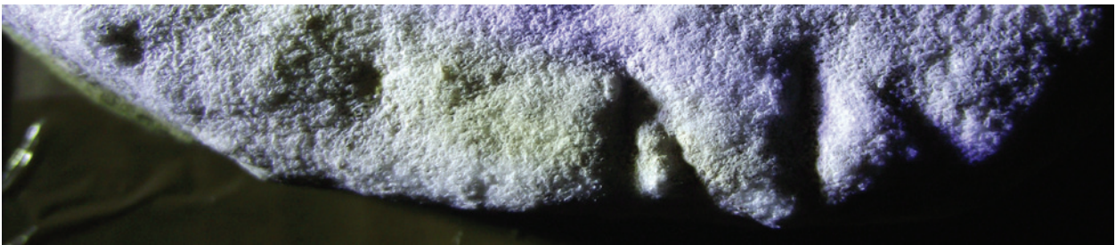
Figura 2 – EE IX 6 , linha 3.