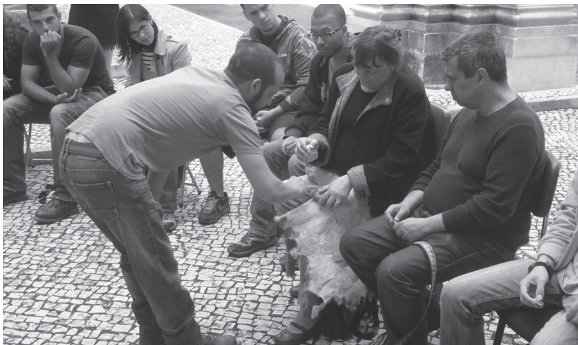
Figura 1 – Workshop de Tecnologia Lítica.

rante os dias 6 e 7 de Junho o “Workshop de Tecnologia Lítica e Talhe Experimental”, leccionado por Sara Cura e Pedro Cura, com 15 formandos (número limite).