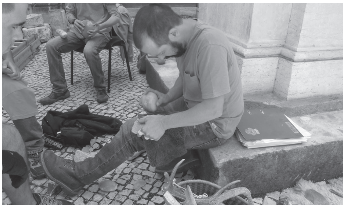
Figura 2 – Workshop de Tecnologia Lítica.